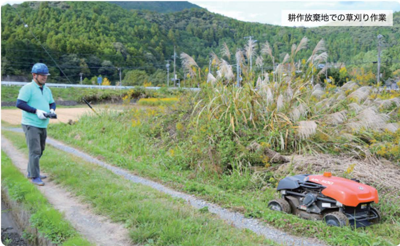
耕作放棄地での草刈り作業