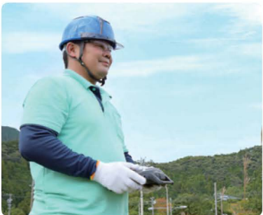
▲プロポで操作。ホビー感覚で簡単に操作できる