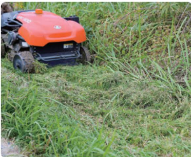
▲フリー刃が草を細かくカットするため、集草が不要